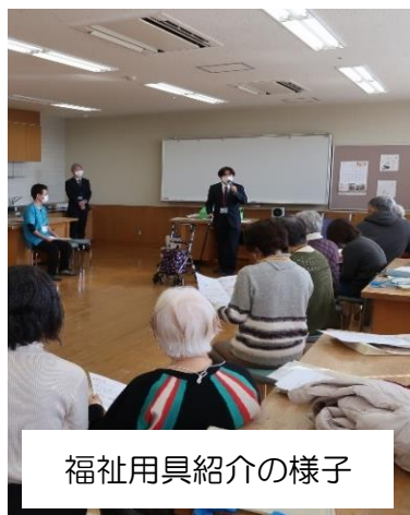
福祉用具紹介の様子