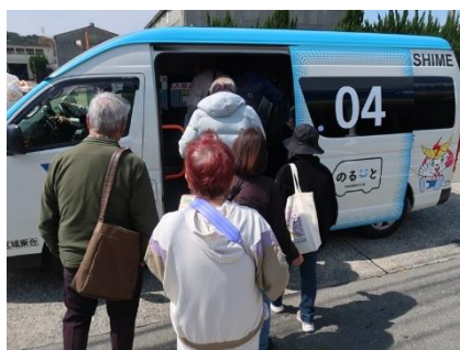
のるーとに乗車して志免総合公園に出発！