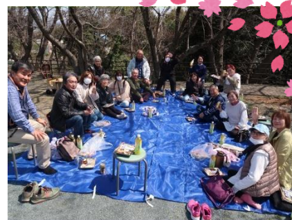
参加者みんなで記念撮影