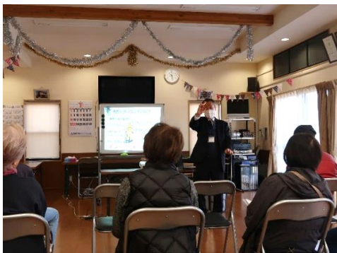
令和8年2月 石橋台町内会での教室の様子

ウンチは健康のバロメーター。ウンチについて正しい知識を身に付けていただくための教室です。