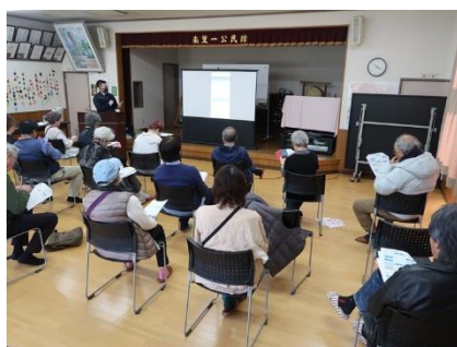
公民館でのるーとの勉強会

令和8年1月にはイオンモール福岡への乗り入れがはじまりました。買い物ツアーや映画鑑賞、ランチ会等を企画して、のるーとの予約方法を知る機会をつくってみませんか？